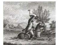
Freiherr von Münchhausen